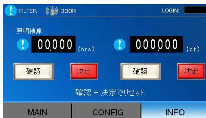
<照明積算リセット画面>

※ 上記の画面より積算時間又は、回数のリセットを行えます。 リセットは部品の交換を行った時に、使用して下さい。