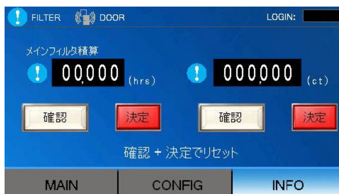
<メインフィルタ積算リセット画面>